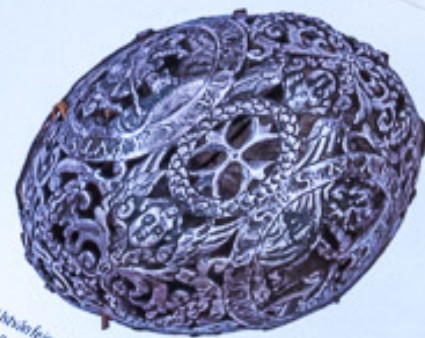
Szent István ereklyetartója - felül rész. Rajosa, XVI század vége