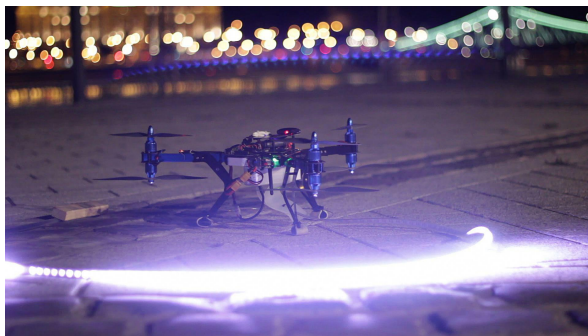
Egy drón segítségével fényfestettük az égboltra