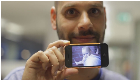
A beküldött képeket feldolgoztuk